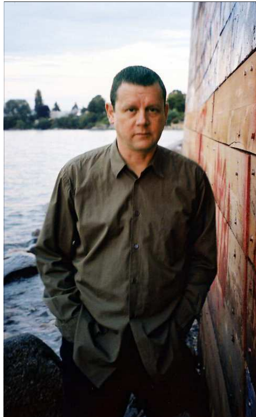
El fotógrafo canadiense Jeff Wall.

Tanto en el ensayo como en la entrevista se desgana la posición de Jeff Wall, un artista decisivo «en